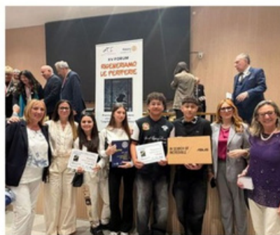
Studenti e insegnanti del "Verri" festeggiano la vittoria nel concorso nazionale del Rotary

premiazione a Palermo presso facoltà di Ingegneria progetto "Legalità e Cultura dell'Etica" a tema "RIGENERAZIONE URBANA DELLE PERIFERIE COME OPPORTUNITÀ DI RISCATTO".