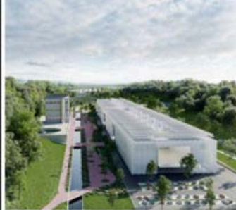
In alto, i ragazzi in visita all'impianto di Expand a Cairate; seguiranno passo dopo passo il recupero dell'area. Qui sopra, il rendering di quello che dovrà essere il risultato finale dell'intervento